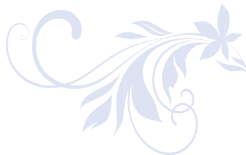
Entdeckungsreise im Schloss