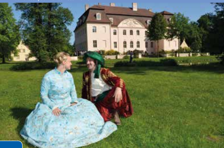
Das Fürstenpaar vor Schloss Branitz