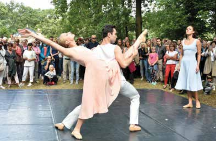
Spielplanpräsentation des Staatstheaters Cottbus: Casanova